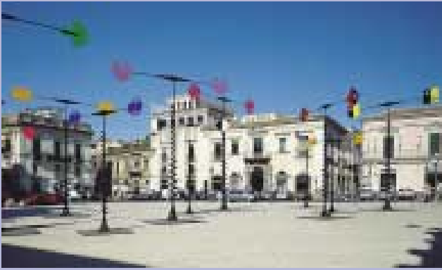
Esposizione delle opere di Takis ad Acireale.

no animate con ritmi diversi se mosse dalla brezza, a ricordare l'esistenza dell'energia che, invisibile, ma presente, muove tutto. Questo è il tema fondamentale della ricerca di Takis.