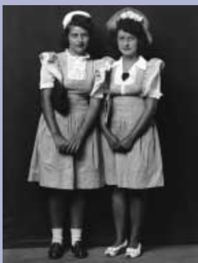
Disfarmer, i ritratti di Herber Springs.

L'apertura della Galleria Credito Siciliano avvenuta ad Acireale nel luglio 2004 ha rappresentato un evento di particolare rilevanza per lo sviluppo dell'attività artistica e culturale del Gruppo. La prima mostra è stata dedicata ad un artista di grande valore e notorietà internazionale, lo scultore greco Takis , riconosciuto dalla critica di tutto il mondo con esposizioni nei più grandi musei internazionali. La mostra ha presentato una raccolta di opere inedite della ricerca di Takis, create appositamente per l'occasione allo scopo di poter realizzare compiutamente il messaggio artistico del maestro e ambientate felicemente parte all'interno della galleria e parte all'esterno, nel cuore della città di Acireale. Opere quali: 1 muro magnetico di 30 metri, 5 sfere musicali, 12 porte magnetiche e 10 segnali eolici, spirali di metallo alte da 3,50 a 6,50 metri, diventa-