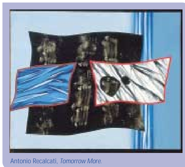
Antonio Recalcati, Tomorrow More .

30 Settembre, ha esposto opere appositamente realizzate dallo scultore per lo spazio espositivo di Milano. Il programma espositivo della Galleria milanese si è concluso con una mostra a carattere storico-documentale sul tema "Un secolo di turismo in Valtellina. Viaggio tra storia e attualità". Il Gruppo Credito Valtellinese sostiene da sempre lo sviluppo turistico della propria area di origine - la provincia di Sondrio - oggi di grande richiamo grazie alle bellezze naturali e all'evoluzione intelligente delle strutture. In occasione dei mondiali di sci del 2005 le ha dedicato una pubblicazione e una mostra, che mettono in evidenza una storia fatta di persone