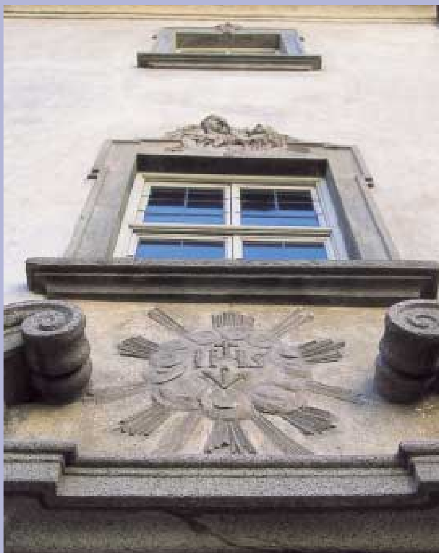
Palazzo Sertoli, particolare.

Nel corso del 2004 la Fondazione Gruppo Credito Valtellinese ha proseguito la sua attività in aderenza ai propri principi statutari ed alle finalità riconducibili alla responsabilità sociale d'impresa per l'attuazione della quale rappresenta l'organismo designato all'interno del Gruppo Credito Valtellinese. I lineamenti programmatici tracciati negli anni precedenti e il consolidamento dell'assetto organizzativo interno hanno consentito di sviluppare un'efficace promozione di iniziative di elevato valore sociale e culturale nei territori di riferimento delle banche del Gruppo.